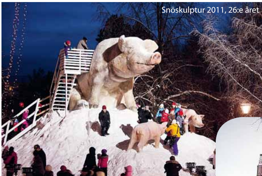
Snöskulptur 2011, 26:e året